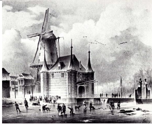
Molen de Noord (2) achter de Kleiwegspoort, anno 1840 door Gijsbertus Johannes Versluis Prent uit 1840

Op deze plek werd later (in ieder geval voor 1832) een stenen stellingmolen gebouwd, Molen De Noord (2), eveneens een korenmolen. Deze molen is in 1863 afgebroken. Aan de ronde vormen van de huidige bebouwing rechts op de hoek Kleiweg / Regentesseplantsoen is de vorm van de oude molen nog te herkennen.