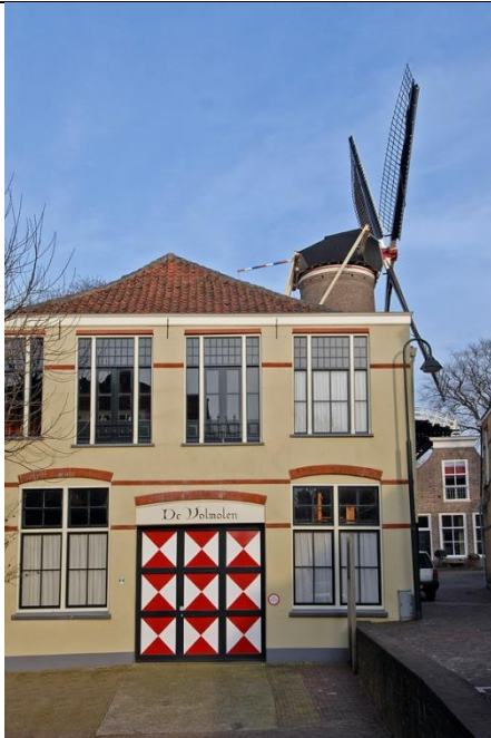
Links staat de Grote Volmolen

Vervolg de Veerstal richting het roodgekleurde Tolhuis. Houdt het Tolhuis aan uw linkerhand. Ga voorbij het Tolhuis even naar links de Oosthaven op en ga dan direct rechts de Punt op.