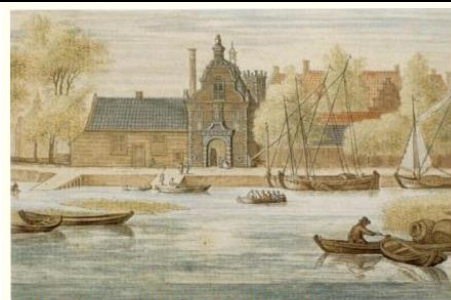
Links van de poort de Kleine Volmolen (Veerstal)

Aan het einde van de Peperstraat (links) heeft “De Kleine Volmolen” gestaan. Deze is gebouwd in 1620 om wol te “vullen”, een onderdeel van de lakenindustrie, waarbij wordt gebeukt op vochtig laken om het weefsel een vastere structuur te geven. Voor die tijd werd dit door mensen (voeten) gedaan. Al in 1414 was er een duiker door de IJsseldijk gegraven die uitkwam op de gracht van de Peperstraat. Boven deze duiker werd “De Kleine Volmolen” in gebruik genomen.