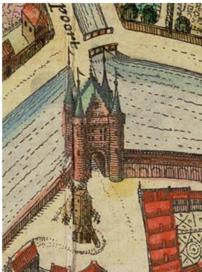
fragment kaart Joh. Blaeu, 1652

Loop het station uit aan de CENTRUM kant. Volg de bordjes "CENTRUM" en loop via de Vredebest naar het Kleiwegplein. Steek het plein en de Kleiwegbrug over.